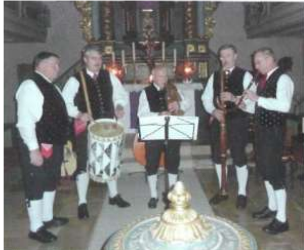
Eine Fränkische Weihnacht mit den "Bad Windsheimer Sängern und Spielern" fand am 17. Dezember in der St. Kilianskirche statt. 120 Besucher ließen sich in dieser besinnlichen Stunde auf ganz besondere Weise auf das bevorstehende Weihnachtsfest einstimmen (Bild oben)