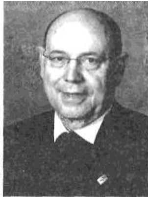
Präses Nikolaus Schneider, Vorsitzender des Rates der Evangelischen Kirche in Deutschland (EKD)

PRÄSES NIKOLAUS SCHNEIDER ZUR JAHRESLOSUNG 2012